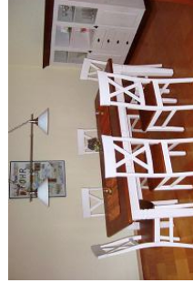
Ob essen oder spielen: hier ist alles möglich.