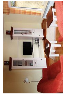
Überall spürbar: die Liebe zum Detail!

Das 2008 renovierte, luxuriös, komfortabel und gemütlich eingerichtete "Waldhaus" liegt idyllisch am Stadtwald im Berliner-Ring. Das Haus liegt ruhig und dennoch sehr zentral im Herzen von Wyk. Abseits des Trubels der Innenstadt erreichen Sie das Zentrum in ca. 10-12 Gehminuten, ebenso wie den feinkörnigen Südstrand, der durch das seichte Wasser (daher ist die Nordsee hier auch etwas wärmer) besonders beliebt bei Familien mit Kindern ist. Alle Versorgungseinrichtungen wie Bäcker, Supermarkt usw. befinden sich in unmittelbarer Umgebung. Das gemütliche "Waldhaus" wurde liebevoll eingerichtet und dekoriert und verfügt über eine umfassende Ausstattung, die keine Wünsche offen lässt. Bei der Konzeptionierung des Hauses wurde größter Wert auf eine entspannte Atmosphäre bei gleichzeitig größtmöglicher Funktionalität gelegt, was sich in der modernen Einrichtung sowie der hochwertigen Ausstattung widerspiegelt. Das ca. 100m 2 große, luxuriöse Haus verfügt über zwei Schlafzimmer, ein großzügiges Wohnzimmer mit integriertem Ess- und Lesezimmer, BAdezimmer mit Dusche und Whirlpool sowie Gäste-WC. In der komplett eingerichteten Küche macht das Kochen auch im Urlaub Spaß.