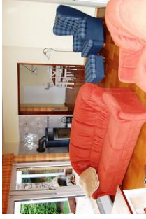
Ein behagliches Zuhause - Freuen Sie sich drauf.