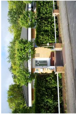
Herzlich Willkommen im Waldhaus!

für 4 Pers. + 1 weit. Kleink. - ca. 100m 2 Wyk, Berliner Ring 1