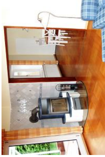
Licht, Luft und viel Platz.